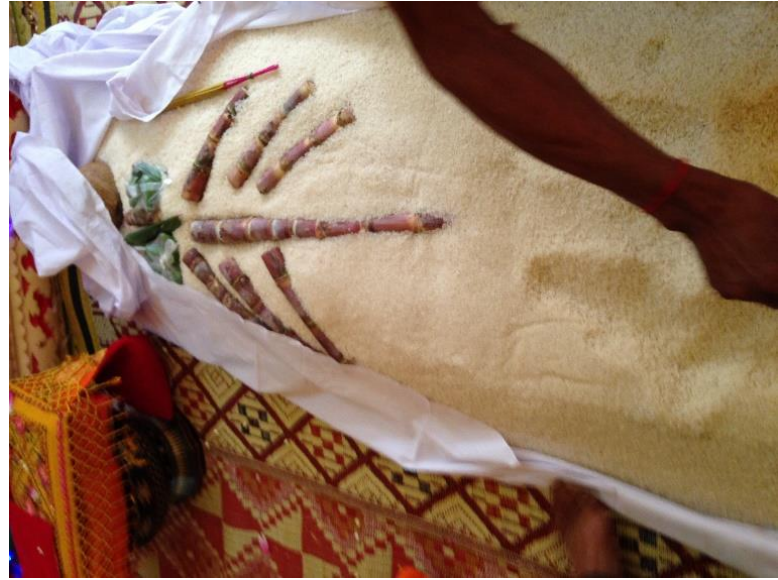
បុណ្យច័ន្ទសុក្រគិរីសូត្រនៅភូមិថ្មល់