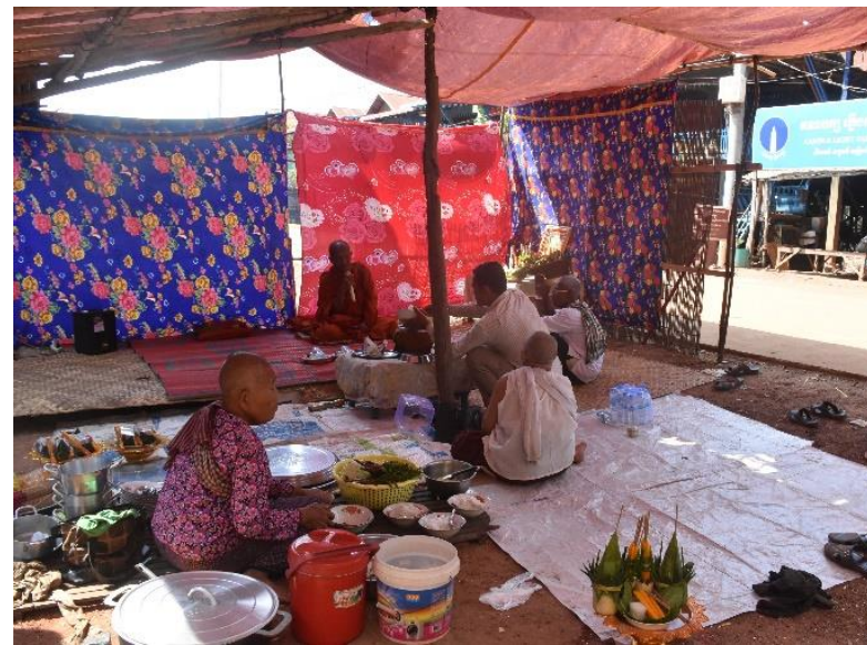
ឆាន់សាន ឬបុណ្យឆាន់ភូមិនៅកំពង់ភ្នំ