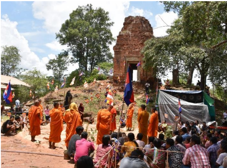
ពិធីសុំទឹកភ្លៀងនៅប្រាសាទលាក់នាងខាងជើងភ្នំបូក

អ្នកស្រុកអង្គរនៅតែពឹងផ្អែកលើទឹកភ្លៀងដើម្បីធ្វើស្រែ ចម្ការ។ នៅរដូវវស្សា ពេលខ្លះភ្លៀងធ្លាក់ពុំត្រូវតាមពេលពេលវេលា ពេលខ្លះ រាំងភ្លៀងទឹកមិនគ្រប់គ្រាន់ ពេលខ្លះភ្លៀងធ្លាក់ច្រើនពេកធ្វើឲ្យសំណាបរលួយខូចក៏មាន ទាំងនេះហើយជាកង្វល់យ៉ាងធំរបស់អ្នកស្រុក។ នៅដើមរដូវវស្សាជាពេលដែលភ្លៀងត្រូវធ្លាក់ហើយ ប៉ុន្តែនៅបន្តរាំងស្ងួតអូសបន្ទាយយូរទៅទៀតអ្នកស្រុកតែងធ្វើពិធីសុំទឹកភ្លៀង។ ពិធីសុំ ទឹកភ្លៀងនេះ ធ្វើខុសគ្នាពីភូមិទៅភូមិមួយហើយជាពិធីទាក់ទងនឹងជំនឿជីវចលតែប៉ុណ្ណោះ តែយ៉ាងណាក៏មានកិច្ចក្នុងពុទ្ធសាសនាខ្លះដែរ ដូចជានិមន្តព្រះសង្ឃចម្រើនព្រះបរិត្តជាដើម។ ជាទូទៅគេច្រើនធ្វើនៅប្រាសាទដែលបង្ហាញពីទំនាក់ទំនងជិតស្និទ្ធរវាងបុរាណដ្ឋាននិងសហ គមន៍មនុស្សជុំវិញ។