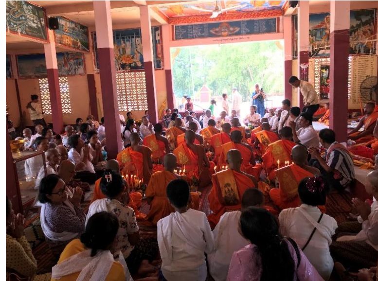
ពិធីបួសនៅភូមិគោកដូង និងភូមិស្នោតជ្រំ