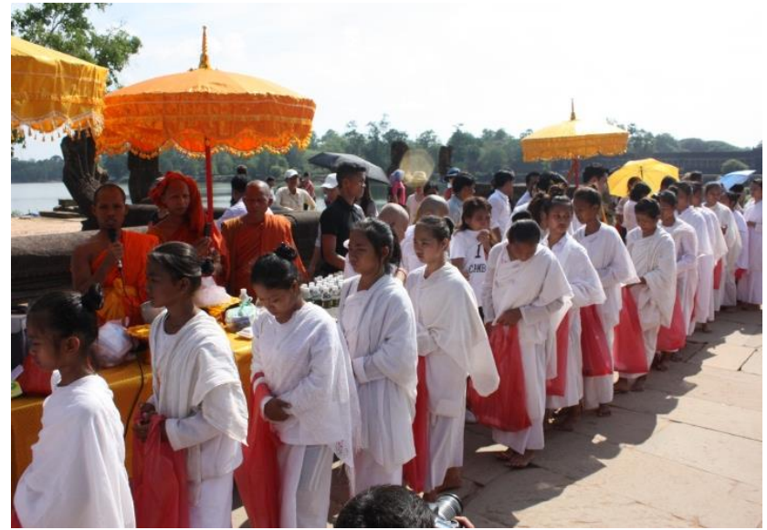
បុណ្យពិសាខបូជានៅវត្តអង្គរខាងត្បូង