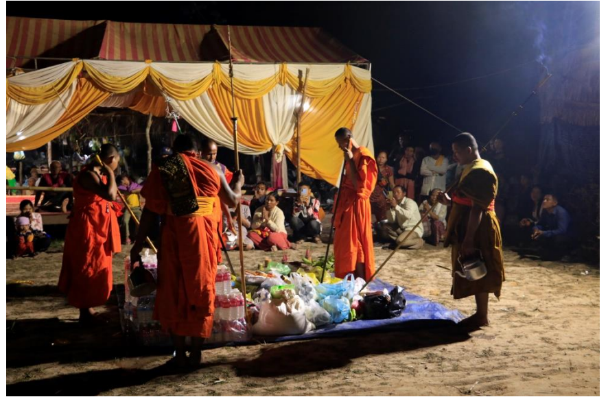
ចូលបរិវាសកម្មនៅវត្តរុន ភូមិតានី ឃុំរុនតាឯក