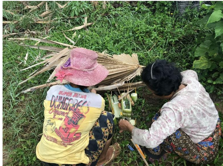
ច័ន្ទសុក្រគិរីសូត្រនៅវត្តអាធ្មារ និងកិច្ចដុតពុតឃ្លូសក្នុងពិធីកាត់គ្រោះនៅភូមិគោកឫស្សី