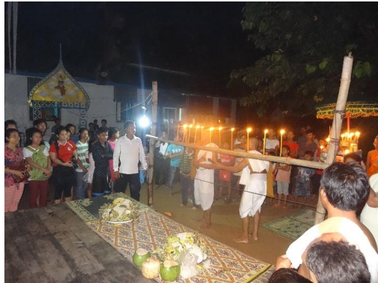
អកព្រះខែនៅវត្តប្រាសាទបាគង