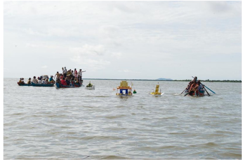
បុណ្យចេញវស្សានៅកំពង់ត្រួត