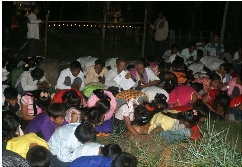
អកព្រះខែនៅវត្តព្រះធាតុ