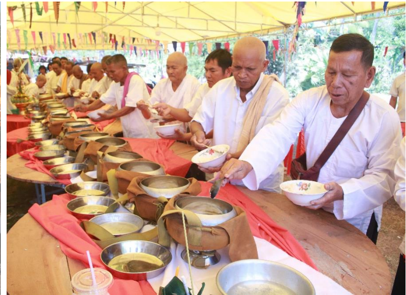
ឡើងមាយនៅភូមិបង្កើង