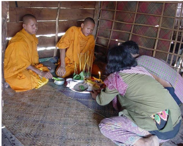
ព្រះសង្ឃនិមន្តសូត្របញ្ជៀសចង្រៃតាមផ្ទះក្នុងថ្ងៃសម្តោងភូមិ