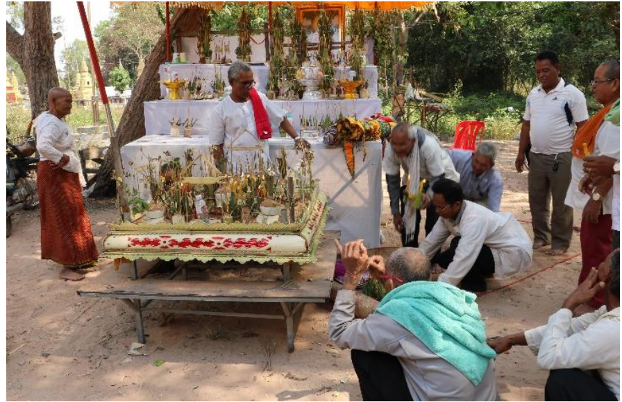
បុណ្យទេសន៍មហាជាតកនៅវត្តបន្ទាយក្បាលចិន