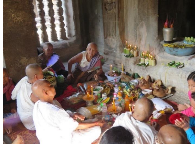
ឡើងមាយនៅប្រាសាទវត្តអាធ្នូរ