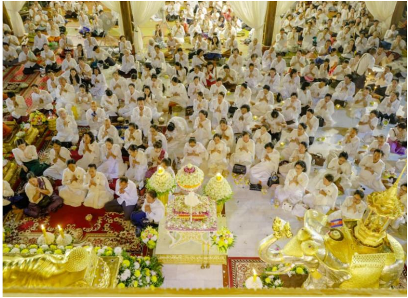
បុណ្យមាយាមនៅវត្តដំណាក់