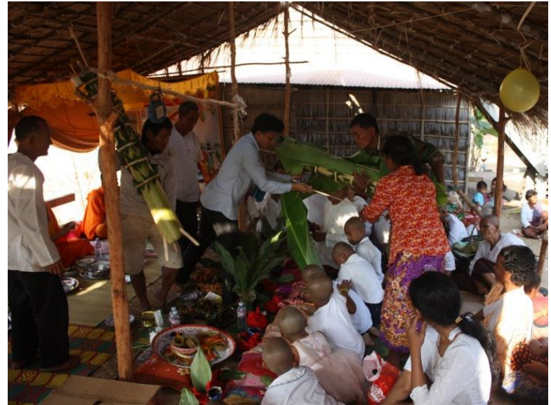
ការជុកនៅភូមិតាត្រៃ