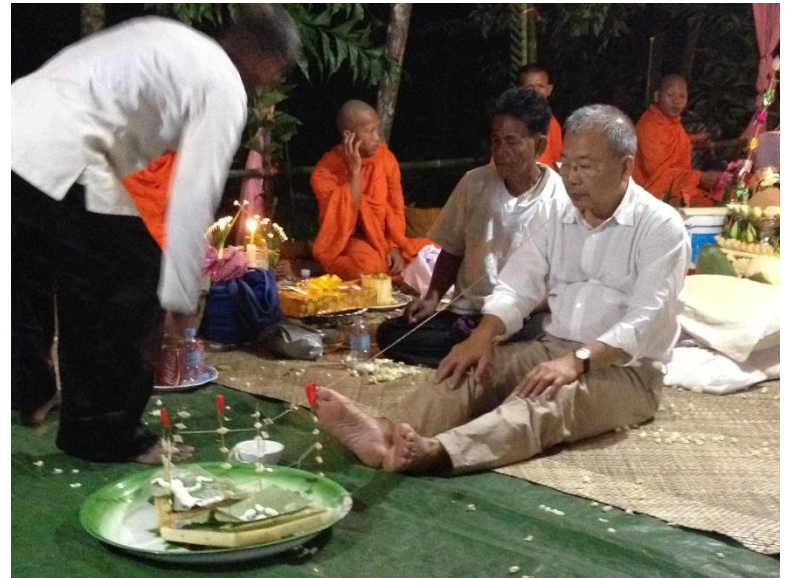
បុណ្យចំនួនសុក្រគិរីសូត្រនៅភូមិរលួស