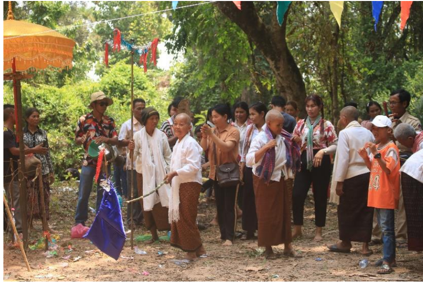
ឆ្លងចេត្រនៅភូមិភូមិគោកឫស្សី