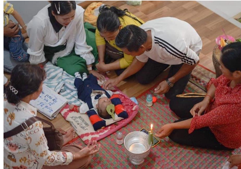
ពិធីកាត់សក់ បង្កក់ធូប ឬទម្លាក់ជើងត្រាននៅភូមិស្ពានជ្រាវ