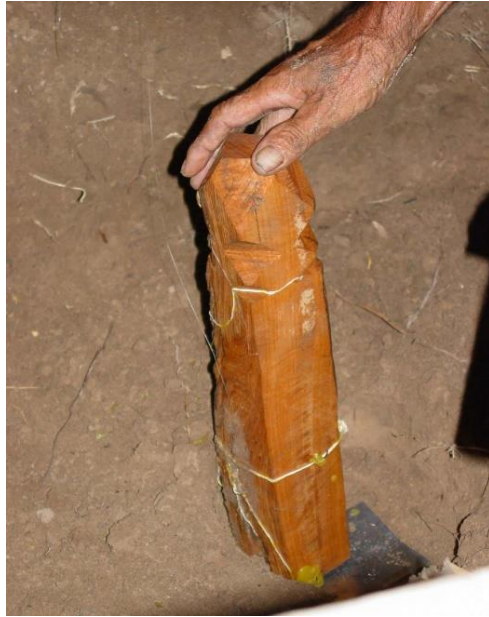
ដាំបង្កោលថ្មីធ្វើជាផ្ចិតភូមិ