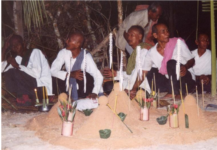
ឡើងមាយនៅភូមិគោកខ្លោត