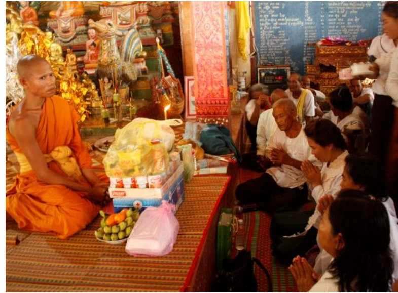
បុណ្យចូលវស្សានៅវត្តប្រដាក