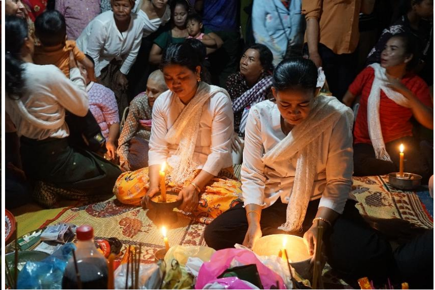
ល្បែងមេមត់នៅភូមិទិតរក្រៅ