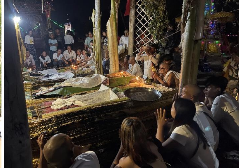
ពិធីបូជាសពនៅតំបន់អង្គរ