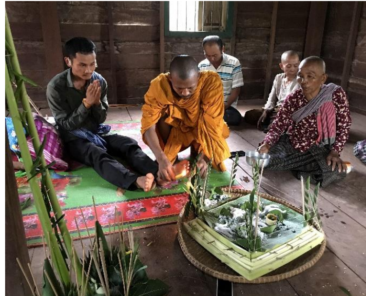
កាត់គ្រោះនៅភូមិគោកឫស្សី