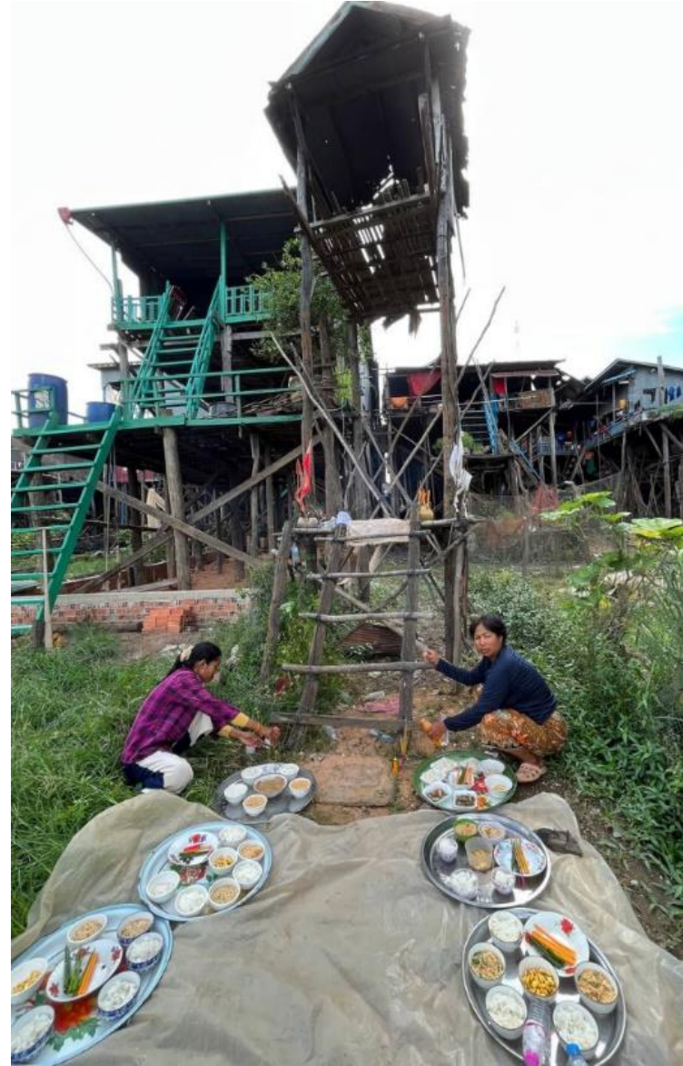
ហែសង្ឃឹកពេលបុណ្យដំណាក់ពេលទឹកស្រក និងពេលទឹកឡើង