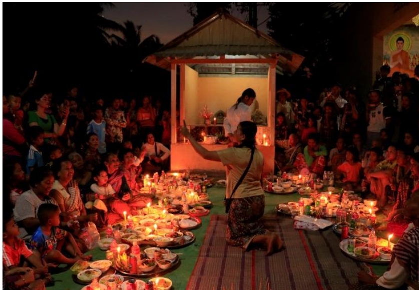
ឡើងមាយនៅភូមិទឹកក្រៅ