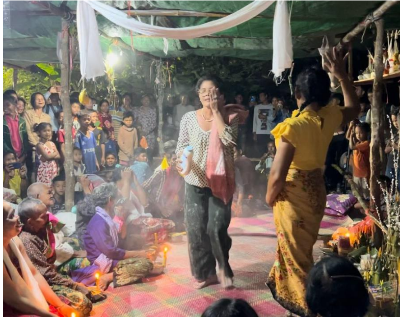
លៀងមេមត់នៅកូមិភ្នំតម្រុំ