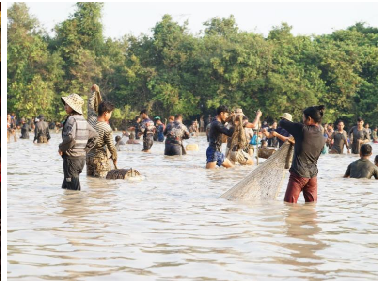
ឡើងមាយនៅភូមិបង្កើង