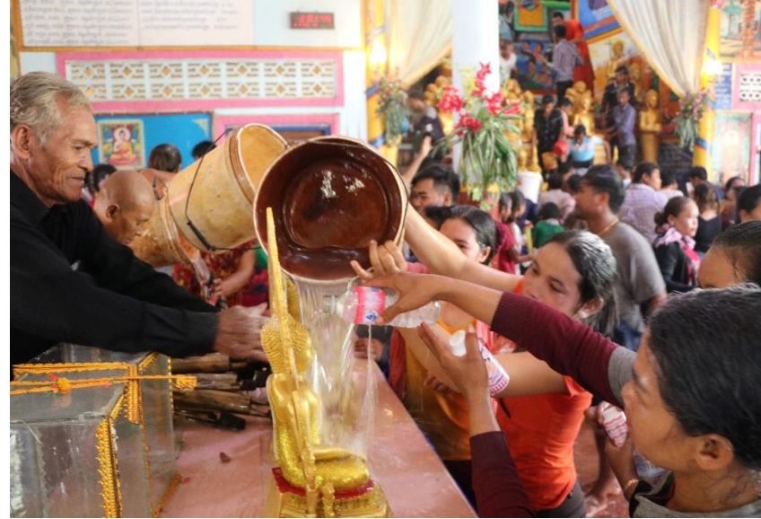
ឆ្លងចេត្រនៅវត្តប្រាសាទបាគង