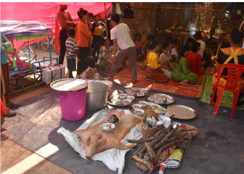
សង្ឃឹកដាក់ដំណាក់នាទឹកឡើង