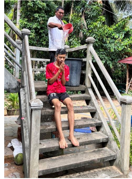
កាត់ត្រោះនៅភូមិរលួស