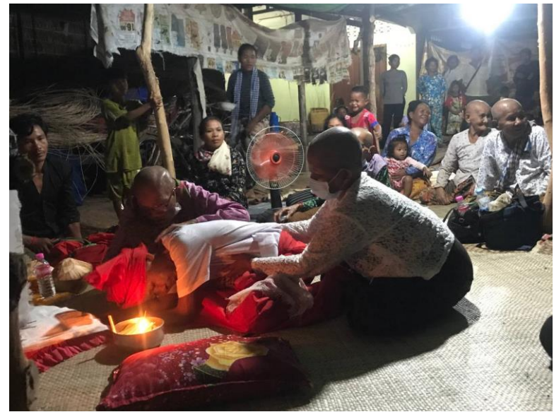
ល្បែងមេមត់នៅភូមិថ្មលំដាប់