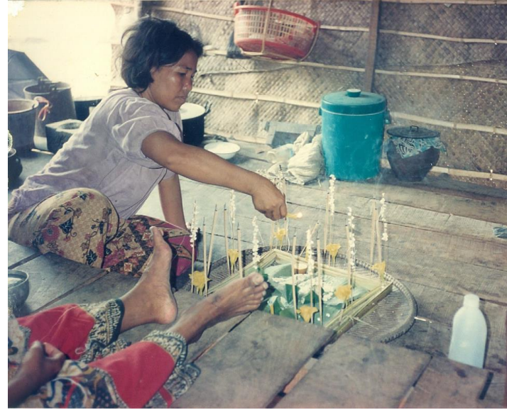
កាត់គ្រោះនៅភូមិប្រហ៊ូត