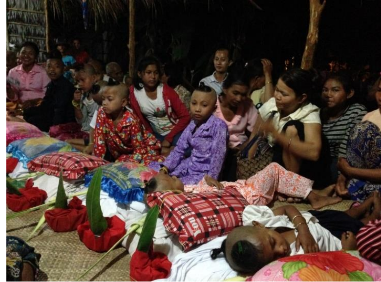
ការជុកនៅភូមិតាត្រៃ