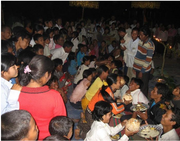
អកព្រះខែនៅវត្តត្រាច

ត្រៀមនឹងច្រូតកាត់។ ពិធីនេះក៏ទាក់ទងនឹងបរិមាណទឹកភ្លៀង និងកោតផលស្រូវដែលនឹងបាននៅឆ្នាំបន្ទាប់។ ពិធីធ្វើនៅពេលយប់ពេល ព្រះចន្ទដើរចំពីលើ។ គេអកត្តាទៅមកក្នុងន័យ "សេសសល់ ហូរហៀរ" និង "សម្បូណ៌ សប្បាយ" ឥតខ្ចះខាត។ ដើម្បីបានអំបុកទាល់ តែមានស្រូវថ្មី ហើយដើម្បីមានស្រូវថ្មី ទាល់តែទើបនឹងច្រូតហើយមិនយូរប៉ុន្មាន។ យប់នោះសោតគេមានកិច្ច "សម្រក់ទៀន" ដើម្បីផ្សង មើលទៅថា ឆ្នាំក្រោយដំណើរភ្លៀងដូចម្តេចដែរ។