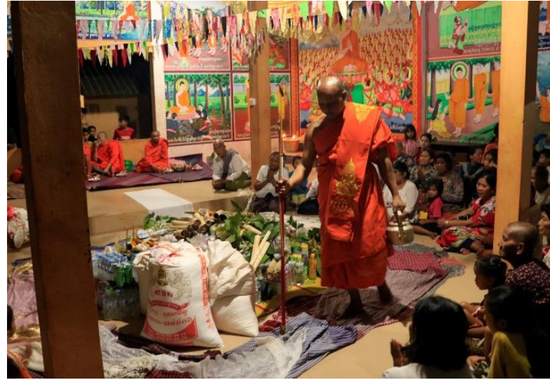
បូជក្រឡាននៅភូមិនគរក្រៅ