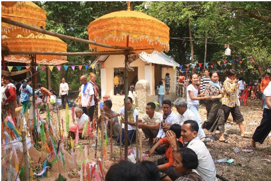
ឆ្នុងចេត្រនៅក្នុងក្រុមគោកបុស្សី