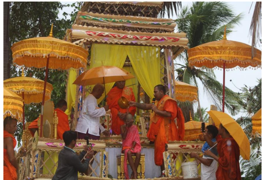
ការជុកនៅភូមិតានី (រុនតាឯក)