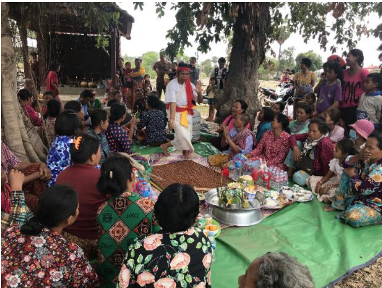
ឆ្នុងចេត្រនៅក្នុងត្បែង

នៅតំបន់អង្គរ ក្រោយពីចូលឆ្នាំហើយប្រមាណមួយ ឬពីអាទិត្យ យើងសង្កេតឃើញអ្នកស្រុកតែងធ្វើពិធីបុណ្យម្យ៉ាងហៅថា «ឆ្នុងចេត្រ»។ ន័យពិតប្រាកដរបស់ពិធីនេះ គឺឆ្នុងផុតពីខែចេត្រចូលទៅខែពិសាខដែល ជាខែភ្លៀងចាប់ផ្តើមធ្លាក់ និងជាខែដែលអាចចាប់ ក្នួររាស់បាន ពោលគឺជា «វដ្តស្រូវ» ឬជា «វដ្ត» ធ្វើស្រែ។ ក្នុងខ្លះធ្វើនៅសាលាឆាន់ក្នុងក្រុម ខ្លះទៀតធ្វើរួមគ្នានៅនឹងវត្ត។