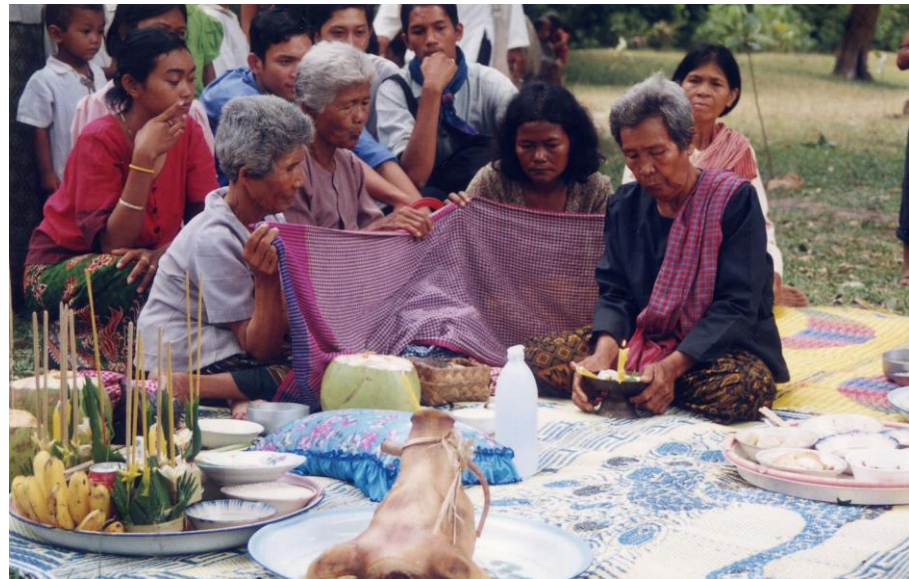
ពិធីសុំទឹកភ្លៀងនៅប្រាសាទមេបុណ្យខាងកើត