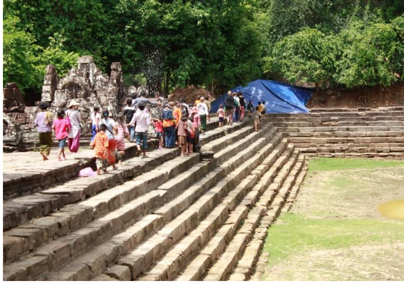
ពិធីសុំទឹកភ្លៀងនៅប្រាសាទនាគព័ន្ធ