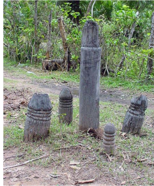
ផ្ចិតភូមិ ឬព្រះភូមិ