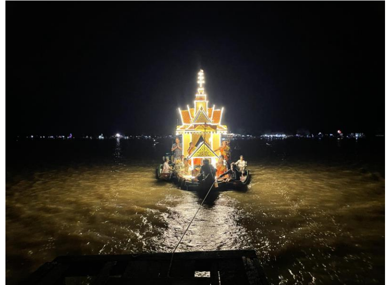
បុណ្យចេញវស្សានៅវត្តអារញ្ញសាគរ