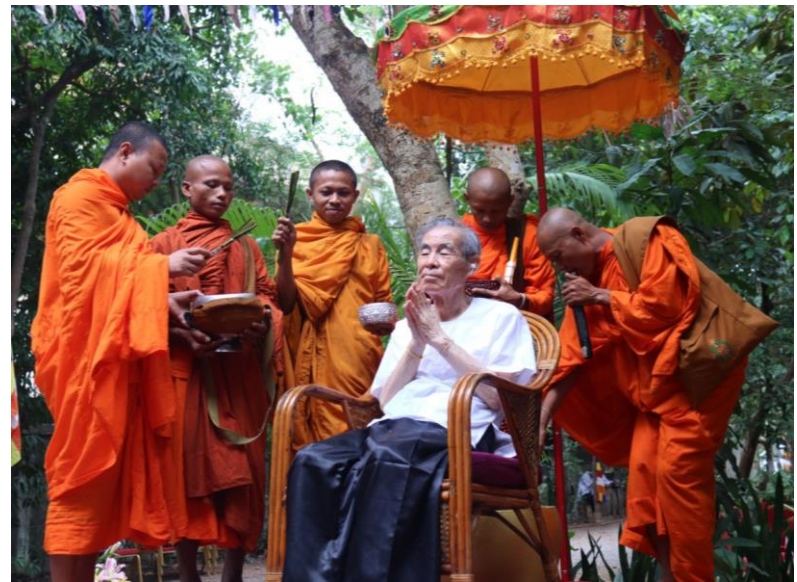
បុណ្យចំនួនសុក្រតិវិស្វត្រនៅភូមិទ្រាំង