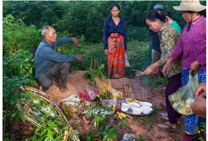
កិច្ចបញ្ជូននៅភូមិចំបក់ ឃុំរលួស ស្រុកប្រាសាទបាគង